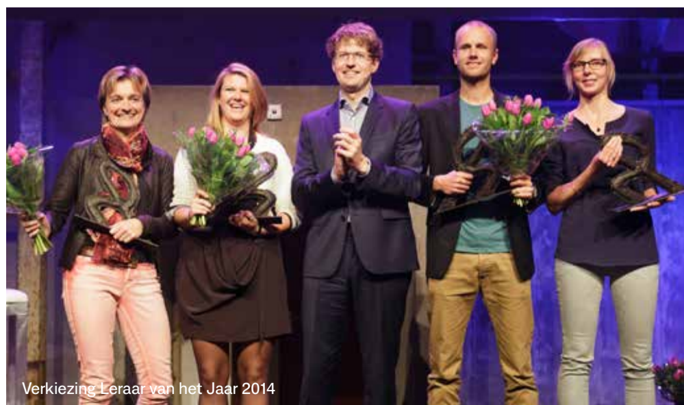
Verkiezing Leraar van het Jaar 2014